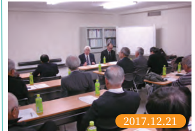
横浜市のOBで組織される横浜下水道研究会(YGK)総会に話題提供者として参加