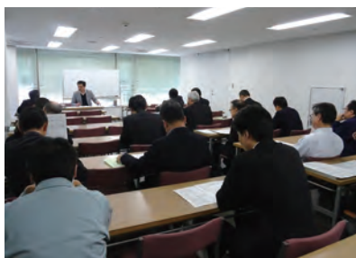
市コン幹部の会議である運営会議