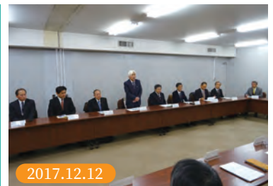
第9回横浜市環境創造局との対話会