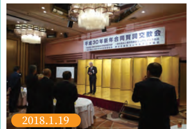
平成30年建設関連4団体新年賀詞交歓会